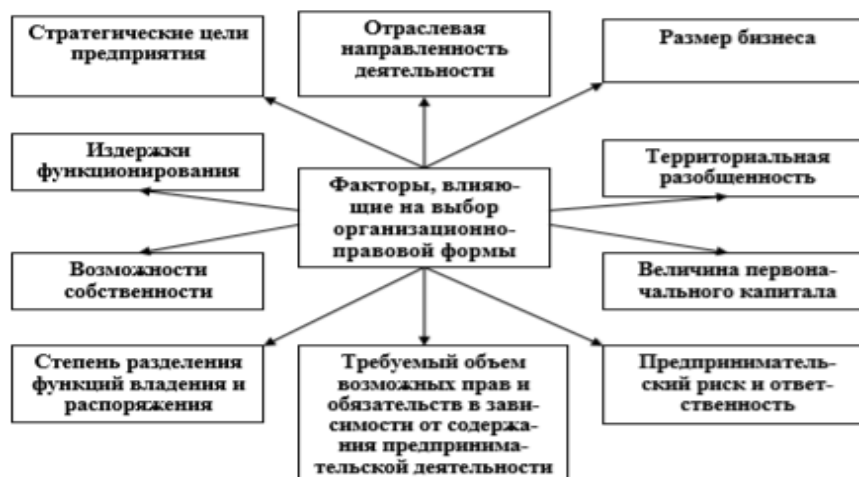
Рисунок 1 – Факторы, влияющие на выбор организационно-правовой формы